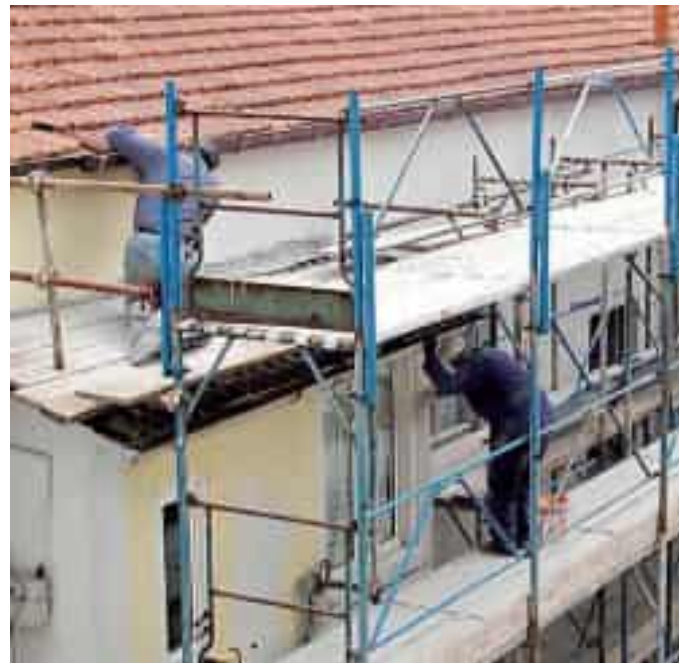
All'Asl 5 mancherebbero 16 ispettori secondo il report Usb Liguria

sti dati nelle apposite sedi come, per fornire un esempio, quella del Coordinamento della sicurezza sul lavoro della Regione Liguria, dove richiediamo da tempo di poter essere ammessi ma da cui, ad oggi, nessuna risposta ci è pervenuta – afferma l'Usb della Liguria – Inoltre sembra che, a differenza di quanto enunciato sempre dalla Strategia nazionale in materia di salute e sicurezza nei luoghi di lavoro, in quelle sedi non vi sia alcun tipo di confronto con le parti sociali». I tecnici della prevenzione effettuano controlli nelle aziende e nei cantieri, verificano il rispetto delle norme sulla sicurezza e in-