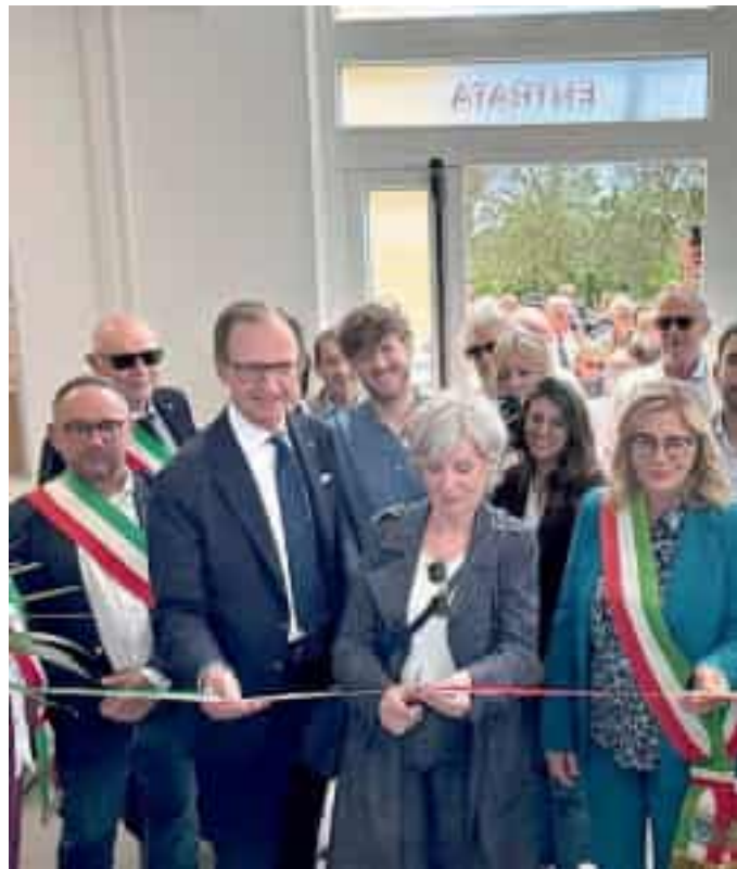
Il taglio del nastro della nuova Casa di Comunità di Luni

Al piano terra le sale per l'accoglienza, il Pua e il Cup, ambulatori infermieristici e medici – tra cui quello del Medico di Medicina Generale aperto dal lunedì al sabato dalle 8 alle 20 senza appuntamento – e una sala prelievi con relativa area di attesa di prossima attivazione. Al primo piano sala polifunzionale a servizio della collettività, un'altra aperta alle associazioni locali e di volontariato, una sala riunioni, un ufficio amministrativo, un