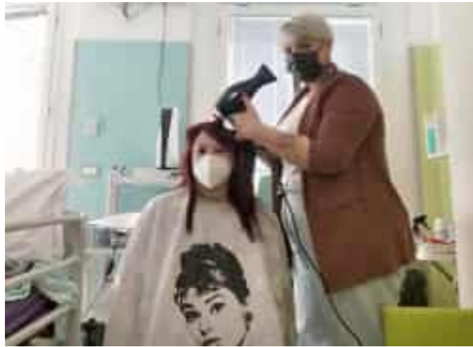
Una messa in piega in ospedale durante una delle passate iniziative