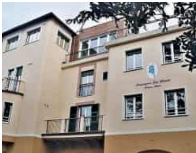
L'hospice di Albaro sarà acquistato dalla Fondazione Gigi Ghirotti

Per finanziare l'operazione, le aziende potranno aderire garantendo specifici metri quadrati di cura: 25 mila euro per 50 mq, 50 mila per 100 mq, 100 mila per 200 mq, fino a 150 mila per 300 mq, con possibilità di deduzione fiscale fino