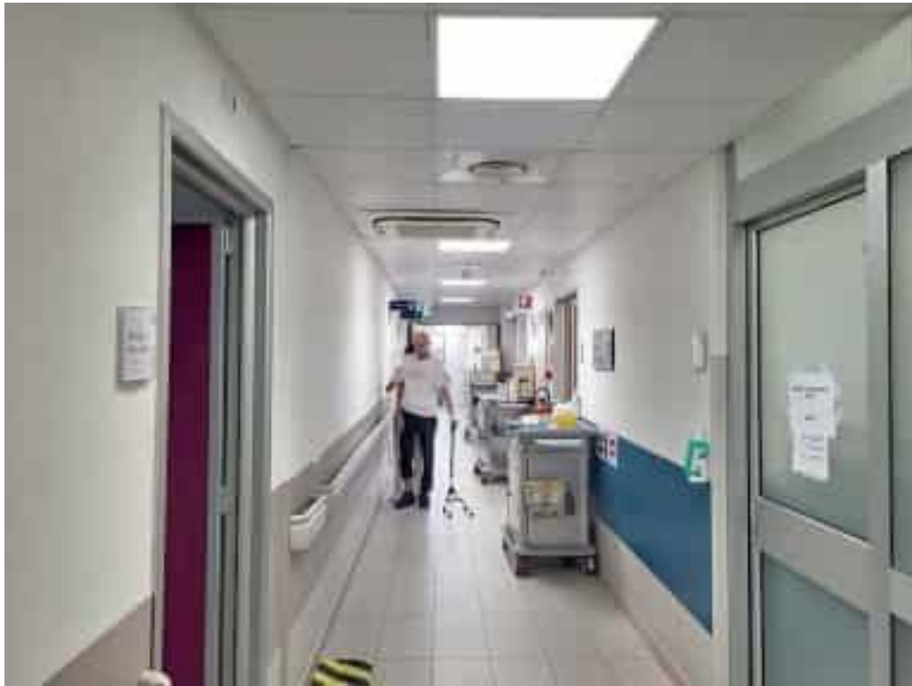
Paziente durante una fase di rieducazione all'istituto Don Gnocchi di via Fontevivo

Il nodo principale è quello dei contratti collettivi rimasti fermi da anni. Nella Fondazio-