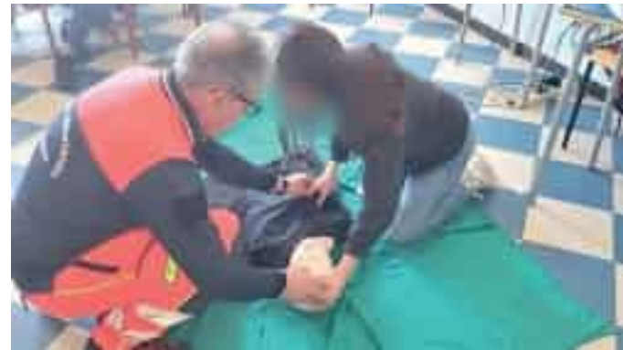
Un intervento simulato durante il corso alla Formentini-Fontana

I ragazzi hanno imparato a riconoscere un arresto cardiaco e a intervenire con il massaggio, comprendendo l'importanza di mantenere il ritmo per "comprare tempo" in attesa dei soccorsi professionisti. Attraverso simulazioni pratiche (come la manovra di Heim-