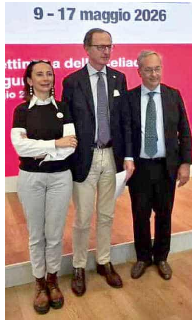
↑ La presentazione della settimana della celiachia