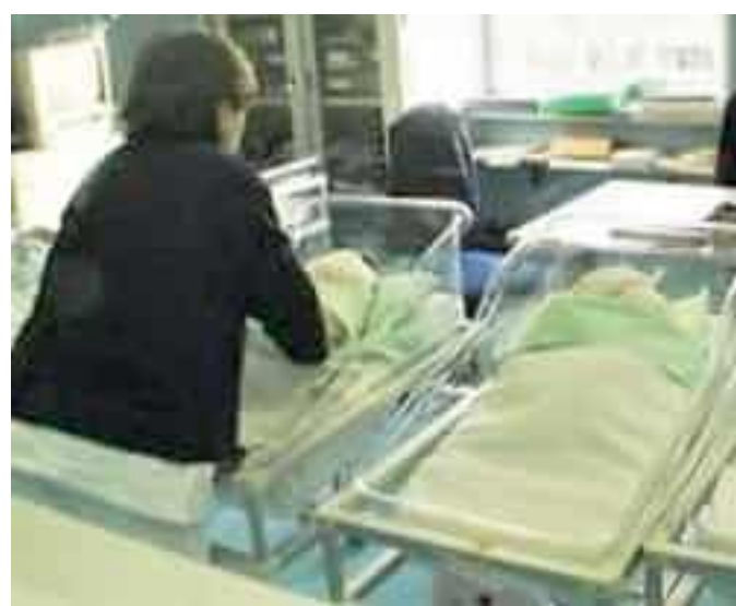
Al San Martino uno dei centri accreditati per la fecondazione eterologa

La fecondazione eterologa, che prevede l'utilizzo di gameti donati da terzi, è un diritto garantito dai Livelli essenziali di assistenza (Lea) ma, fino ad oggi, molte coppie liguri erano costrette a rivolgersi a centri fuori regione con costi e disagi aggiuntivi: «Le coppie liguri potranno essere seguite vicino a casa, in strutture riconosciute dall'Istituto superiore di sani-