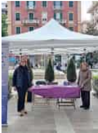
Iniziativa contro la fibromialgia

ta dal Comitato Fibromialgici Uniti, col patrocinio del Comune, in collaborazione con l'assessorato alle Politiche Sanitarie e con il gruppo spezzino di "Camminata Metabolica".