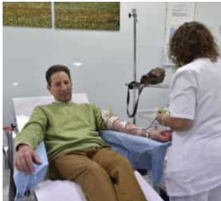
Un uomo impegnato nella donazione di sangue (foto di repertorio)