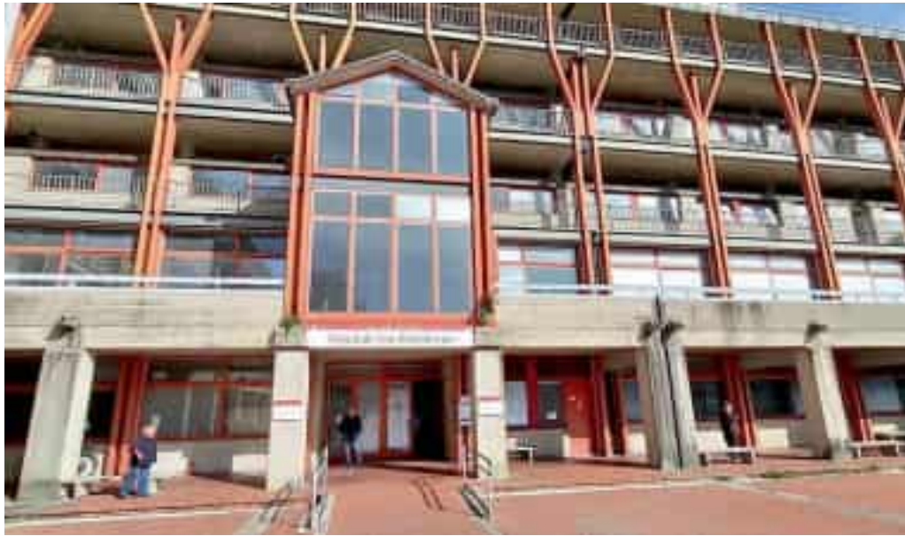
L'ingresso dell'ospedale San Bartolomeo di Sarzana