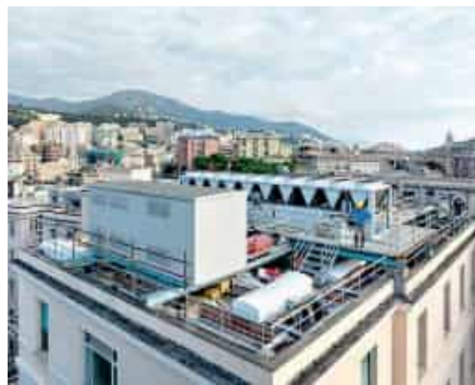
Alcune fasi dell'installazione del nuovo sistema antisismico sul tetto del Padiglione Specialità dell'ospedale San Martino