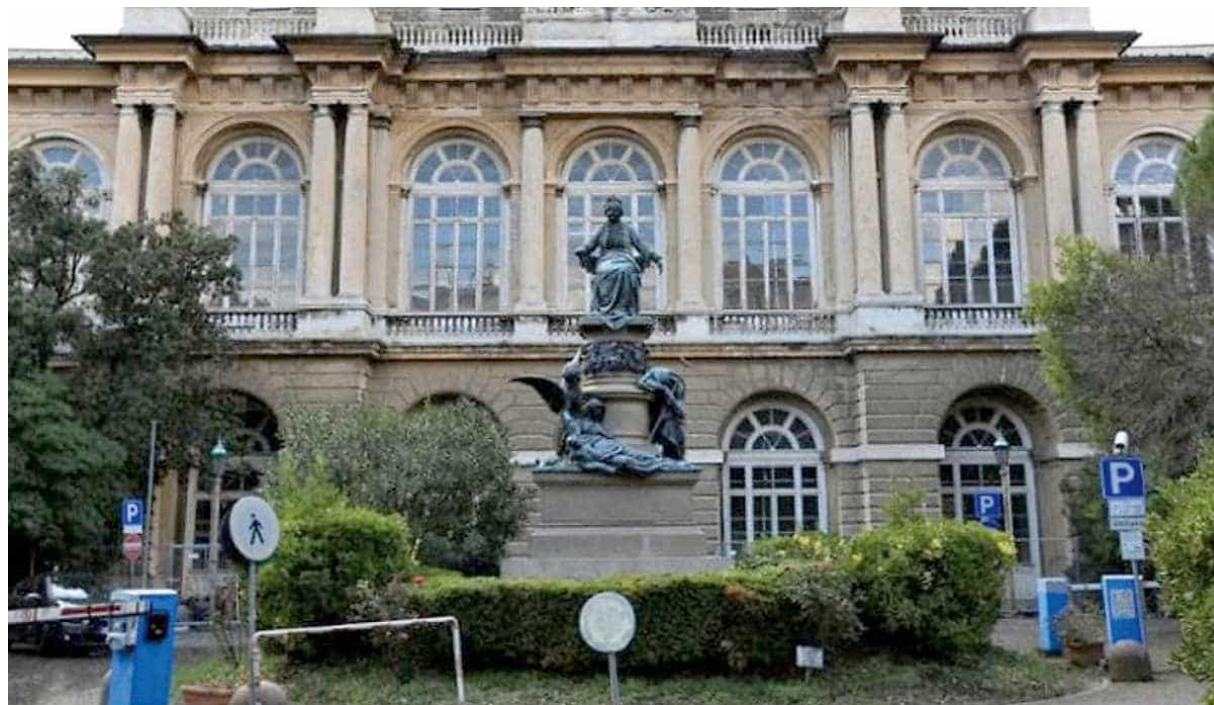
➤ L'ospedale Galliera inserito nell'azienda ospedaliera metropolitana

E ieri si è levata intanto la fumata bianca per la legge di riforma sanitaria della Liguria da parte del consiglio dei ministri che (come prevedibile) dopo le rilevazioni, non ha proceduto all'impugnazione. Ora il testo passerà al ministero che attende la modifica chiesta alla Regione, rispetto alla denominazione dell'Aom. Il nuovo nome sarà "Aom-Irccs San Martino" e comprenderà anche Villa Scassi e Galliera, senza che questi ultimi, come invece previsto nella prima versione, possano fregiarsi della dicitura Irccs, attribuita solo a Policlinico. Sembrano invece composti i rilievi fatti dal ministero sui compensi dei dirigenti, valutata la riduzione complessiva del-