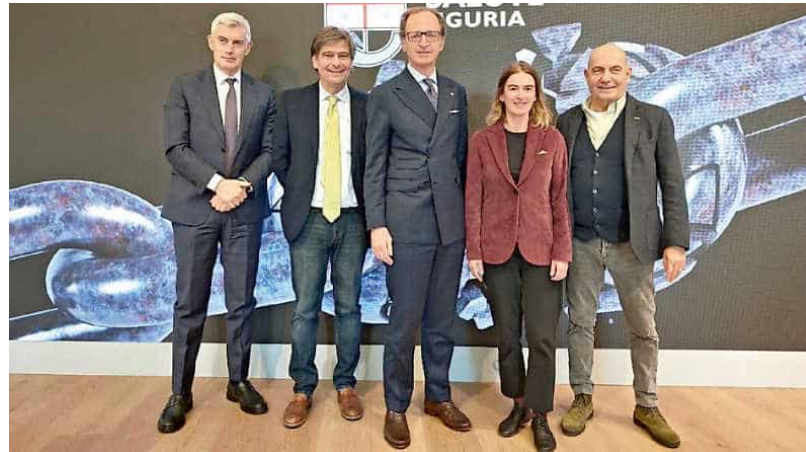
📍 Specialisti e amministratori in prima linea sul fronte dipendenze

S ono circa 6 mila le persone seguite dal sistema sanitario ligure per problemi legati all'uso di sostanze, a cui si aggiungono 600 pazienti per gioco d'azzardo. Un problema che colpisce anche le fasce più giovani, con una lieve crescita crescono delle segnalazioni di detenzione di sostanze sotto i 14 anni, che comunque non rappresenta una tendenza. Per prima volta da quando viene monitorato, invece, si registra un sorpasso delle ragazze sia nel consumo di alcol, che in una