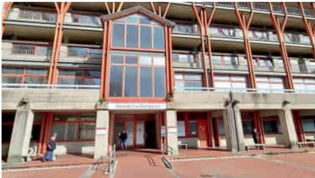
L'ospedale San Bartolomeo di Sarzana

Di fatto si tratta di un'emergenza che non si arresta, rispetto alla difficoltà dei lavoro