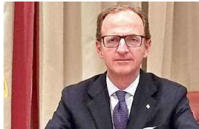
↑ Massimo Nicolò

L'assessore regionale Massimo Nicolò: «Grazie a chi ha capito l'importanza di un servizio sempre più vicino ai cittadini»