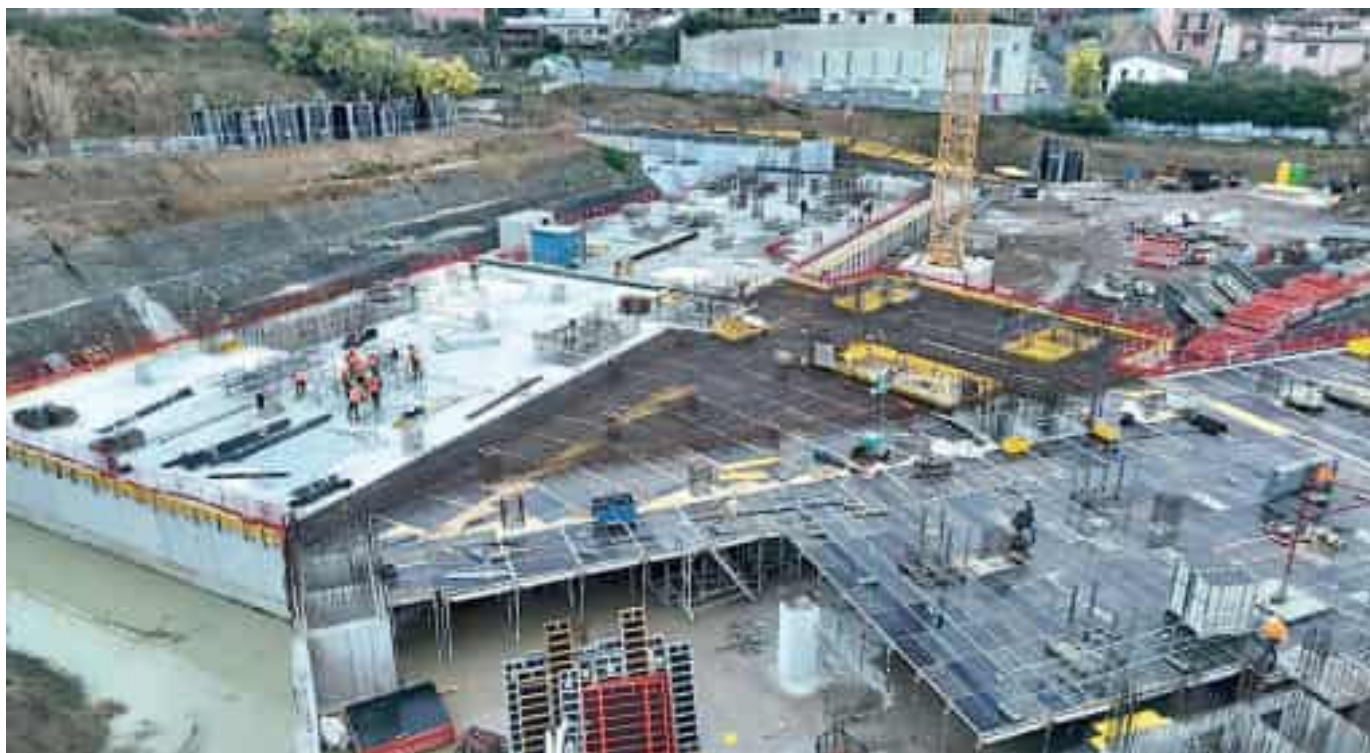
Nelle foto il cantiere del nuovo ospedale del Felettino

saranno i 74 pilastri di sostegno. «Ne sono stati già realizzati tanti, parliamo di decine - rende noto Bucci - oltre alla costruzione dei nuclei ascensore e dei vani scala. Ed i solai sono in costante fase di avanzamento. La struttura prende forma, è il segno concreto di un lavoro serio che sta andando avanti».