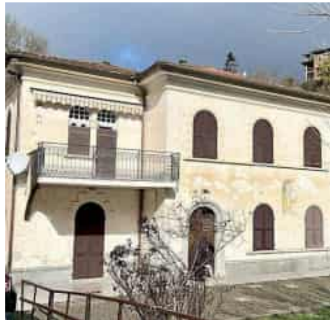
La casa presidio socioriabilitativo per disabili